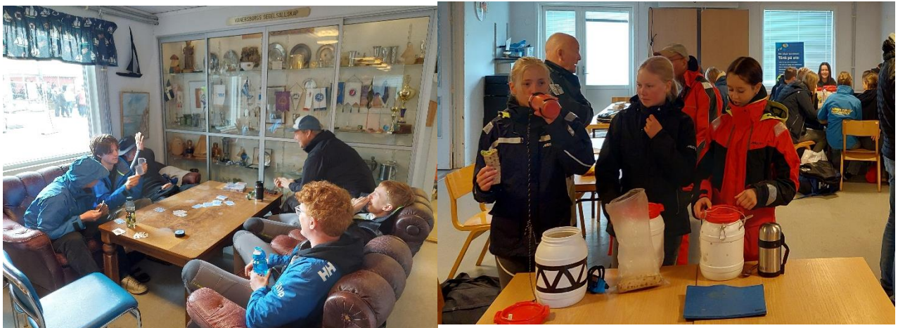
Bilder från jolletävling på Sanden.

Under vinterhalvåret 2022 har vi haft fysträning som vanligt. På våren under ledning av Anders och i slutet av året har våra seglare i Röd-Svart grupp hållit i träningen i Blåsutskolans gymnastiksal med sedvanlig cirkelträning. Aktiviteten engagerar både seglare och föräldrar.