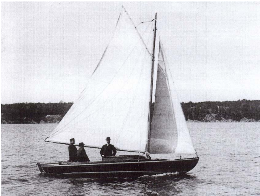
En välkänd seglarbild i början av 1900-talet. Märk besättningens prydliga klädsel.