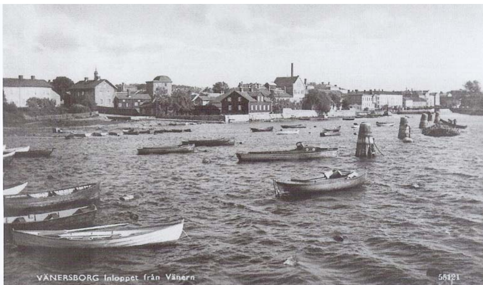
Så här förtöjdes båtarna i Vänersborg tidigare, Observera "mosorna" utefter dykdalberna.

I ett nytt möte 22 oktober 1907 utbryter en livlig diskussion där följande alternativ framkommer: